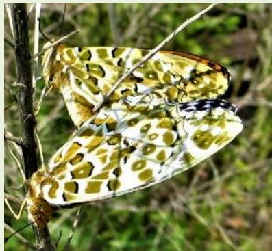
ツマグロヒョウモンの交尾