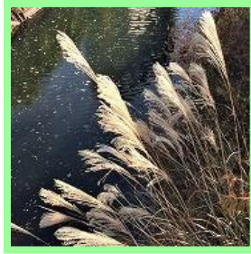
ススキ等のイネ科