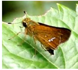
▲イチモンジセセリ