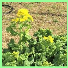
アブラナ／イヌガラシ等