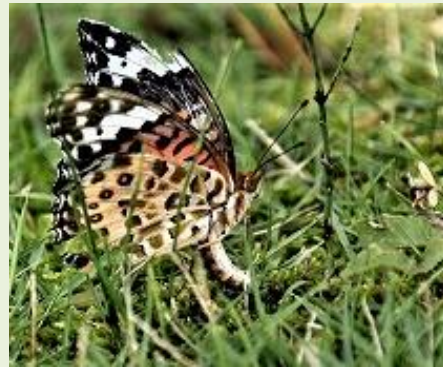
スミレに産卵するツマグロヒョウモン