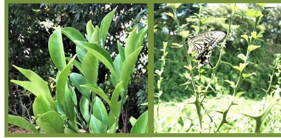
ミカン/カラタチ/サンショウ類