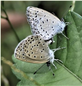
ヤマトシジミの交尾