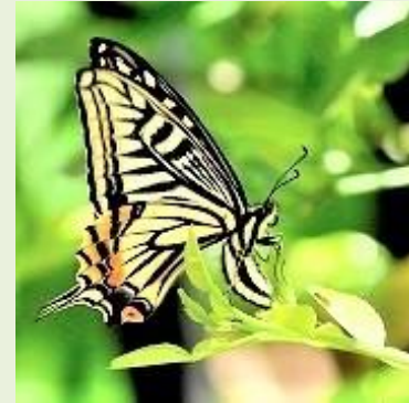
カラタチ／サンショウに産卵するナミアゲハ